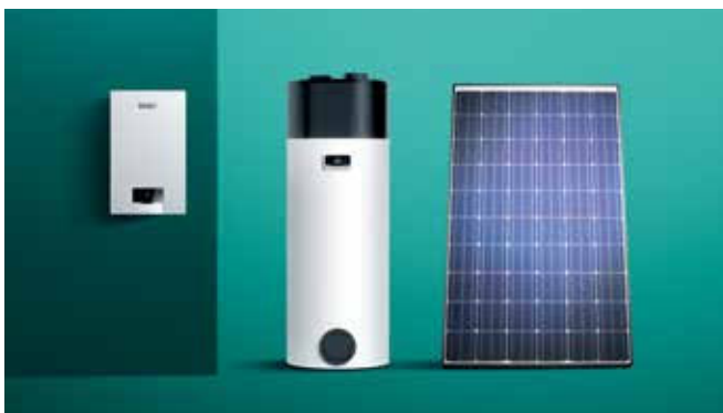
Fleksibilna integracija u sustav.

Novi usklađen dizajn i koncept rada sučelja naših plinskih kondenzacijskih uređaja za grijanje zajedno s našim regulatorima, ugradnju i korištenje čini bržim no ikada. Brza daljinska provjera i prilagodba uređaja za grijanje putem našega novog sensoCOMFORT regulatora i aplikacije sensoAPP.