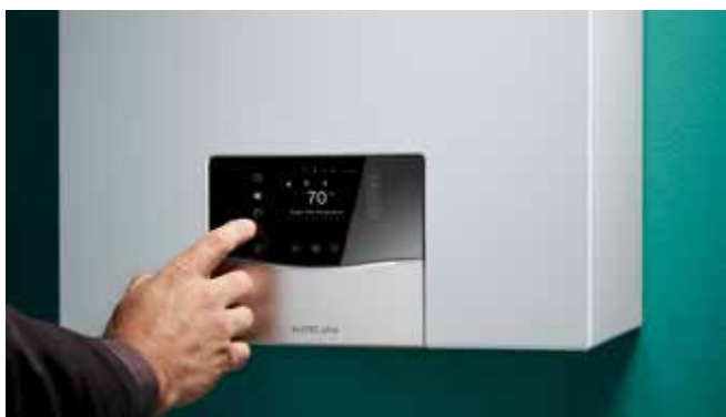
Udobnost upravljanja putem integriranog rada na dodir

Novi usklađen dizajn i koncept rada sučelja naših plinskih kondenzacijskih uređaja za grijanje zajedno s našim regulatorima, ugradnju i korištenje čini bržim no ikada. Brza daljinska provjera i prilagodba uređaja za grijanje putem našega novog sensoCOMFORT regulatora i aplikacije sensoAPP.