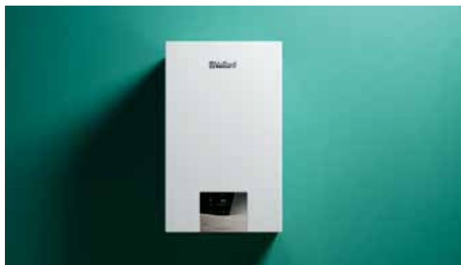
ecoTEC plus VUW

Zahvaljujući njegovoj novoj inteligentnoj značajki „IoniDetect“, uređaj potpuno samostalno upravlja promjenama u vrsti i kvaliteti plina. Svojim kupcima uvijek možete jamčiti optimalno izgaranje, a da sami niste morali ništa učiniti.