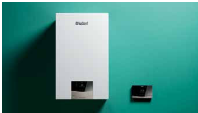
ecoTEC exclusive uređaj sa sensoCOMFORT regulatorom

uređaji opremljeni izmjenjivačem topline od nehrđajućeg čelika za najbolji mogući rad. Uz dokazane i pouzdane komplete za ugradnju, uvelike vam olakšavaju montažu. Zahvaljujući uklonjivim dijelovima kućišta, sve su glavne komponente savršeno dostupne za lako održavanje.