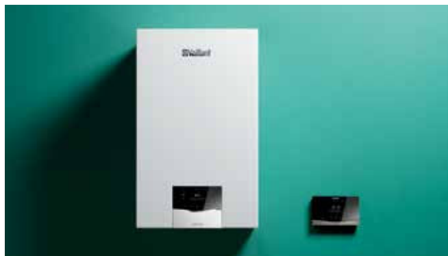
Najbolji omjer cijene i radnih značajki: Povežite ecoTEC plus uređaj sa regulatorom sensoHOME